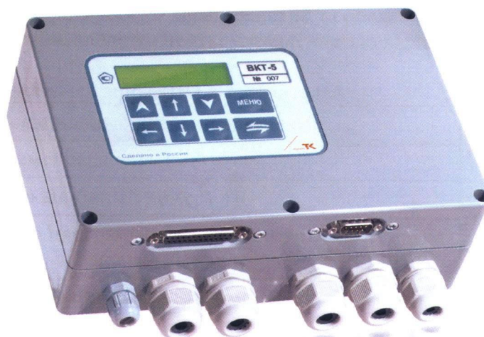
Рисунок 1 – Общий вид вычислителя

В целях предотвращения несанкционированного доступа к узлам регулировки и к ПО, а также к элементам конструкции, предусмотрены места пломбирования, указанные на рис. 2.