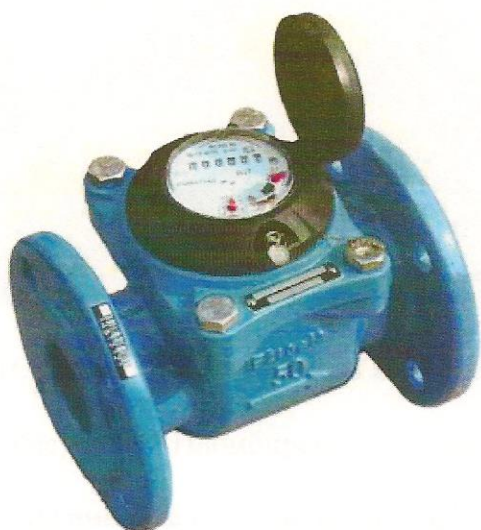
а) Счетчик воды турбинный ВСХН-50

Общий вид счетчиков воды турбинных ВСХН, ВСХНд, ВСГН, ВСТН приведен на рисунке 1.