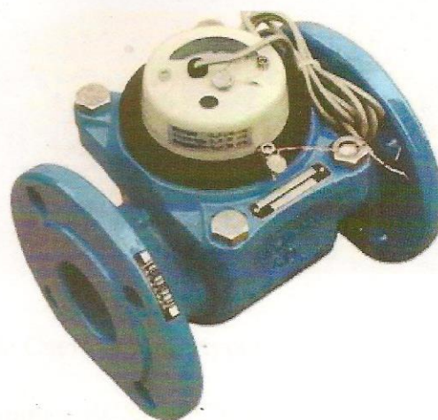
б) Счетчик воды турбинный ВСХНд-50