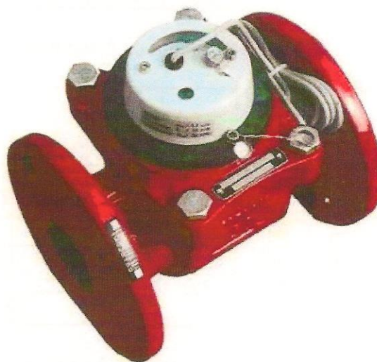
г) Счетчик воды турбинный VSTH-50