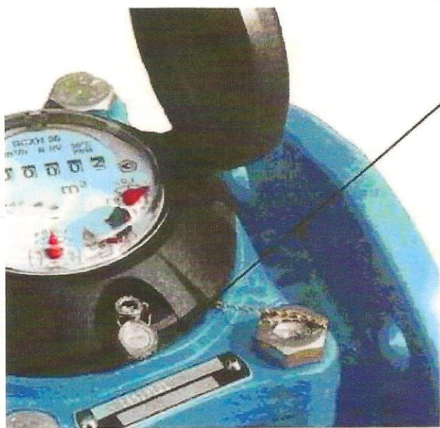
а) Счетчик воды турбинный VSXH-50

Схема пломбировки счетчиков воды турбинных VSXH, VSXHд, VSGH, VSTH приведен на рисунке 2.