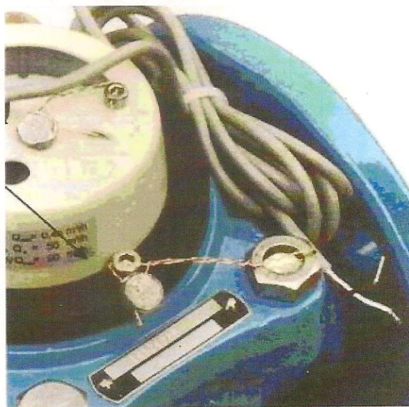
б) Счетчик воды турбинный VSXHд-50